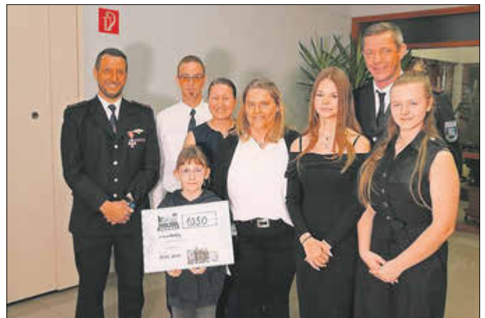
Übergabe Spendscheck in Höhe von 1.050 € vom Kinderkleiderbasar an die Jugendfeuerwehr Reichenbach.