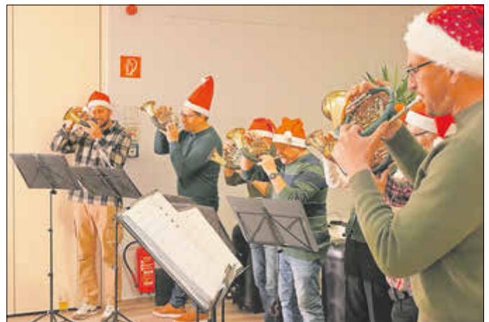
Musikeinlage der Jagdhorngruppe Plothen