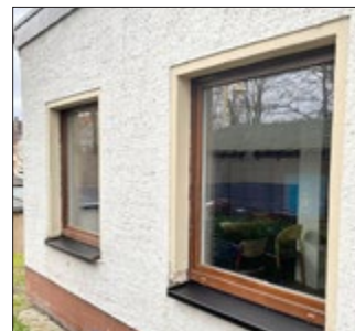
Im Sportlerheim wurden alle 8 sanierungsbedürftigen Fenster ausgetauscht.