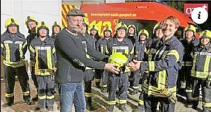
Für die Kameraden der Feuerwehr wurden 25 neue Schutzhelme angeschafft.