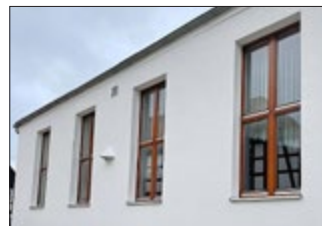
Teilerneuerung der Fenster des Schwansaals.