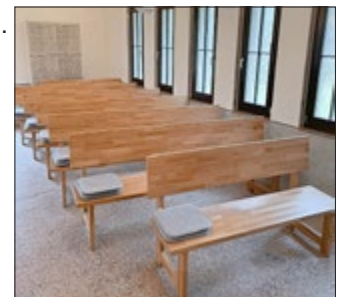
Anfertigung neuer Sitzbänke in der Trauerhalle.