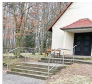
Anbringung eines Geländers an der Treppe zur Trauerhalle

Im vergangenen Jahr hat die Gemeinde St. Gangloff trotz der angespannten Haushaltssituation u. a. mit Hilfe der Corona Sonderzuweisung verschiedene Projekte umgesetzt, z. B.: