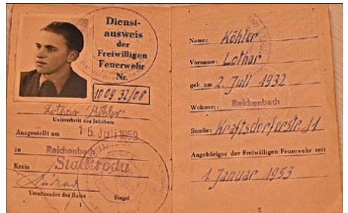
Feuerwehr-Dienstausweis von Lothar Köhler aus dem Jahre 1959