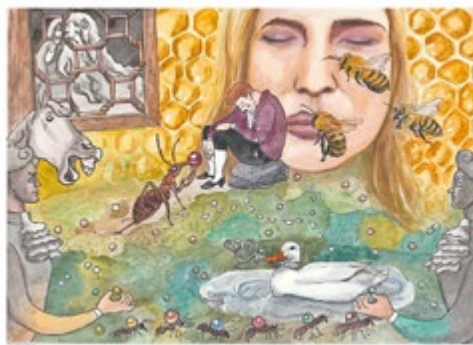
Illustration zum Märchen „Die Bienenkönigin“

Interessierte sind ebenfalls herzlich eingeladen!