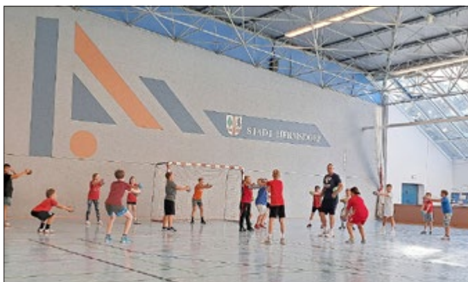
Nachwuchstraining mit dem Weltmeister Christian Schwarzer am Samstagmorgen in der Werner-Seelenbinder-Sporthalle