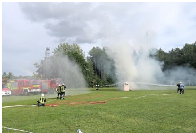
Schauübung auf dem Sportplatz