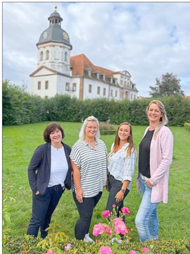
Frau Wehrmeister, Frau Adam, Frau Paul und Frau Schau - Agathe Mitarbeiterinnen

15. Der Reinerlös der Sammlung ist ausschließlich für den vorgesehenen Zweck zu verwenden. Dies ist der Erlaubnisbehörde umgehend in geeigneter Form nachzuweisen.