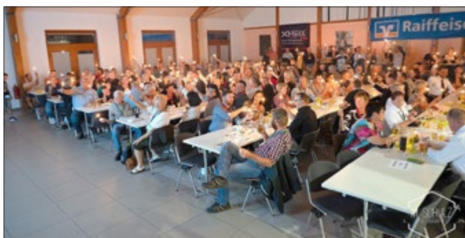
85 Jahre Kaninchenzuchtverein Reichenbach im Bürgerhaus

Vorsitzender Kaninchenzuchtverein T262 Reichenbach e.V.