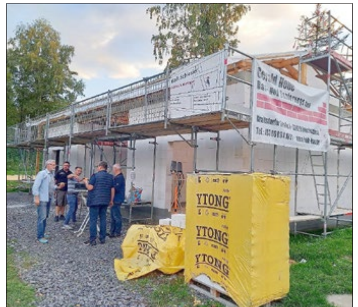
Ansicht des Gemeinschaftsgebäudes im Rohbau

Die Besonderheit bei diesem Neubau liegt in der Gemeinschaftsarbeit der Gemeinde Reichenbach, dem Maibaumsetzerverein Reichenbach und der Feuerwehr sowohl in finanzieller Hinsicht wie auch in der handwerklichen Erstellung mit Unterstützung der ortsansässigen Handwerker. Alle drei Beteiligten erhalten nach Fertigstellung Räumlichkeiten zur Lagerung von notwendigem Equipment