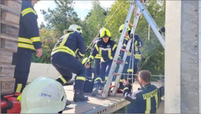
„Grube“ - Ausbildung von Heben von Personen aus Gräben / Gruben