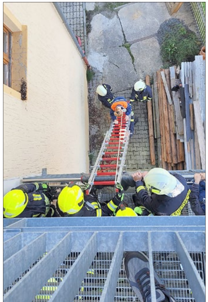
„Leitern“ - Ausbildung Leitern am Kindergarten mit gesicherten Führen von Personen