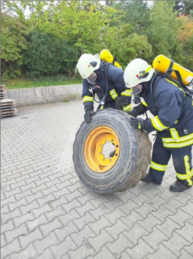
„Atemschutz“ - Belastungstraining unter Atemschutz