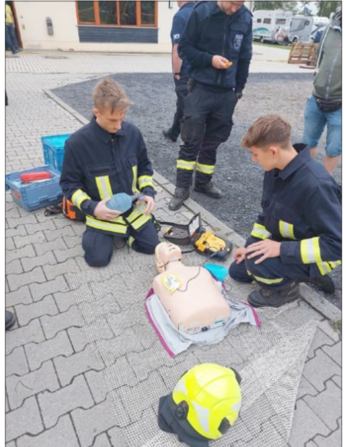
„Reanimation“ - Ausbildung Reanimation an der Übungspuppe